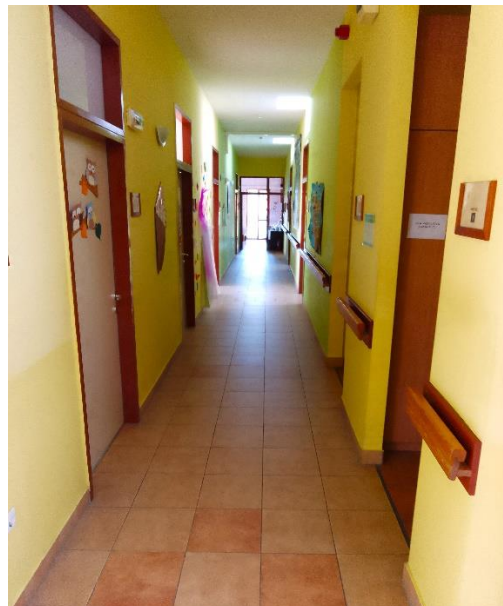
Akadálymentes folyosók (földszint, emelet)