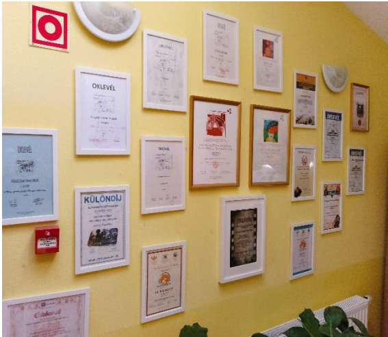
A Speciális Filmes Csoport oklevelei