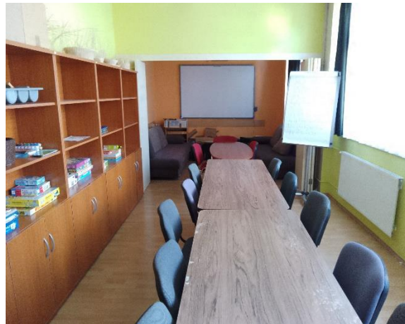
Digitális táblával ellátott terem