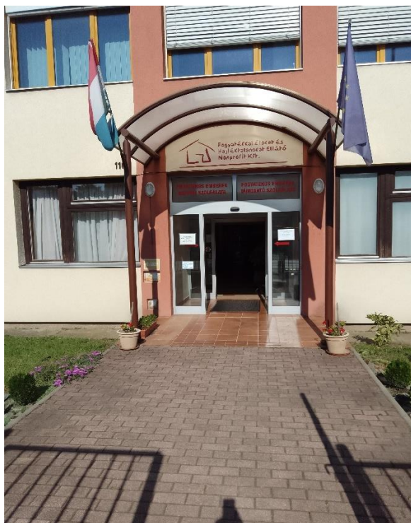
Fogytékkal Élőket és Hajléktalanokat Ellátó Közhasznú Nonprofit Kft.