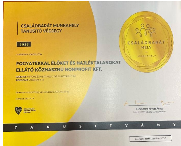
Családbarát munkahely tanúsító védjegy