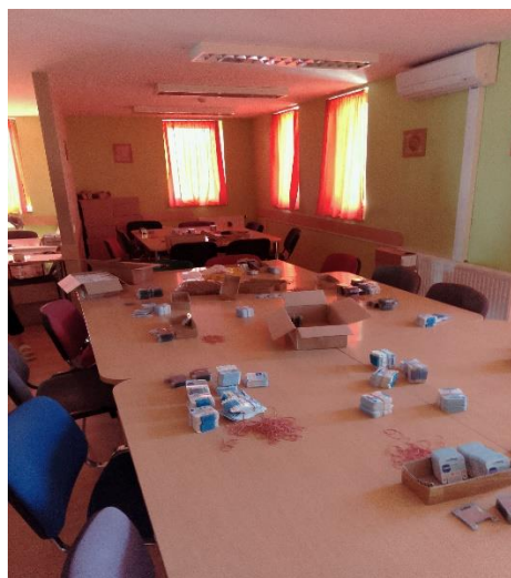
A fejlesztő foglalkoztatás helyiségei