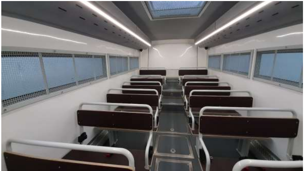
8. számú kép: Új típusú szállító busz biztonsági övekkel