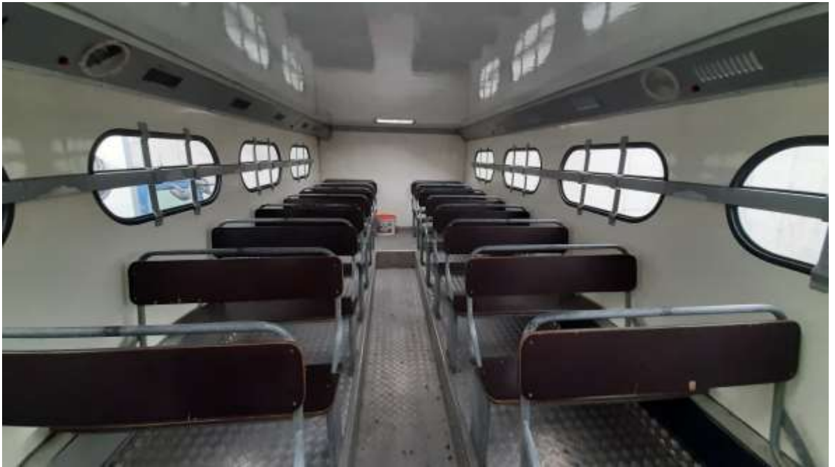
9. számú kép: Régi típusú busz biztonsági övek nélkül