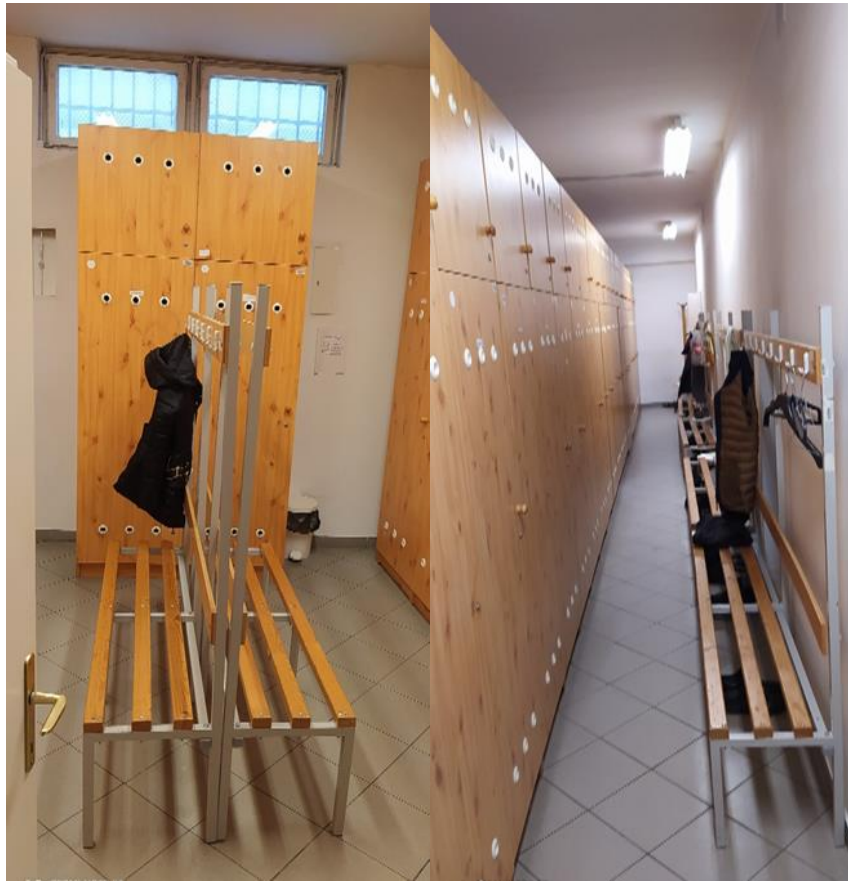
6. Női és férfi öltözőhelyiség az Objektumban