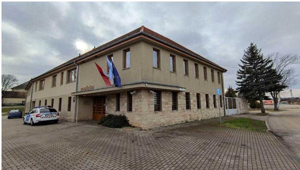
7. A Devecseri Rendőrőrs