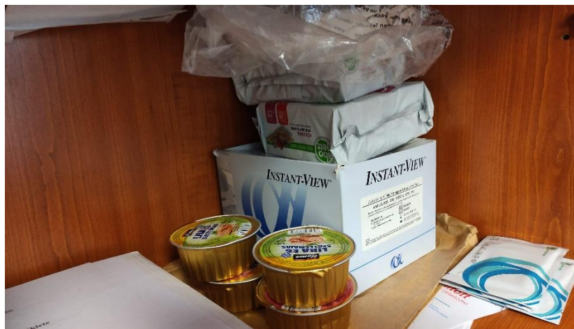
12. Élelmiszerkészlet az Őrsön