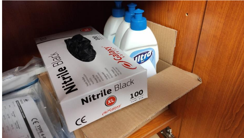
11. Védőfelszerelés készlet az Őrsön