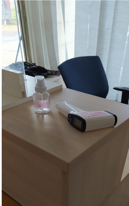
4. Ügyfélirányító pult lázmérővel és fertőtlenítővel