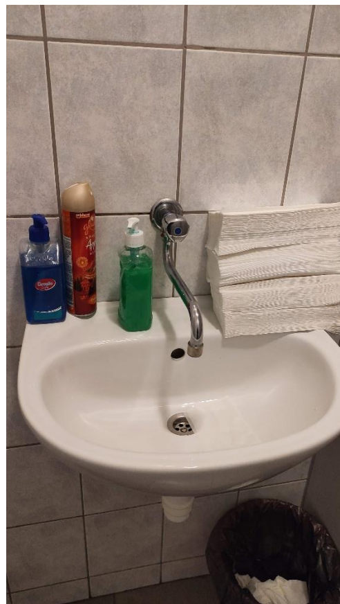
2. Kézfertőtlenítés lehetősége előállításkor 3. Fogvatartottak részére kijelölt mosdó