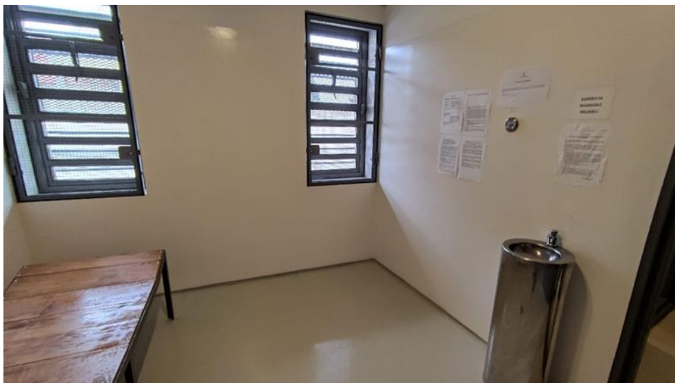
9. Az Őrs előállító egysége