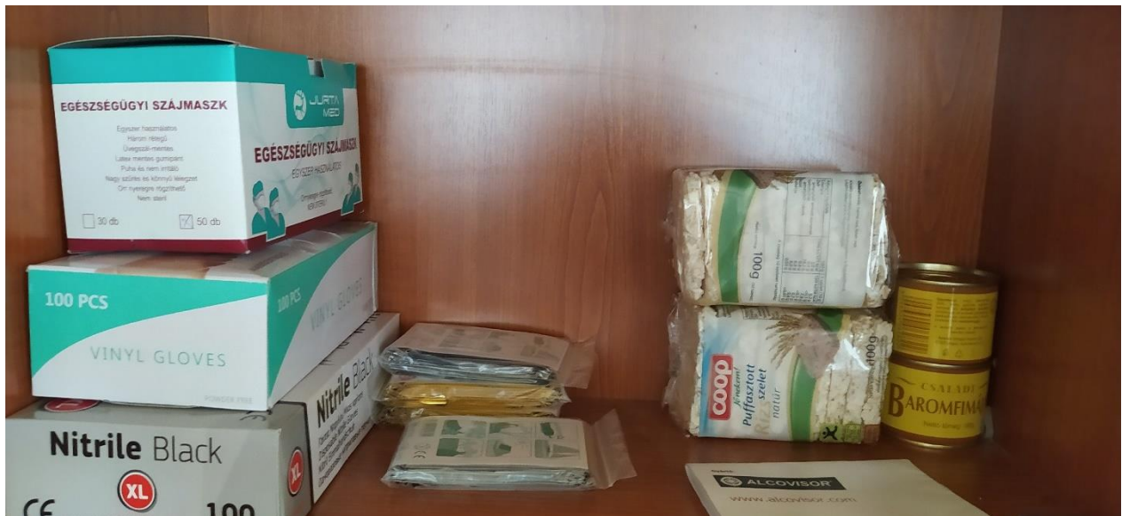
5. Szolgálatirányítói helyiség szekrényében elhelyezett védőfelszerelés és élelmiszerkészlet az Objektumban