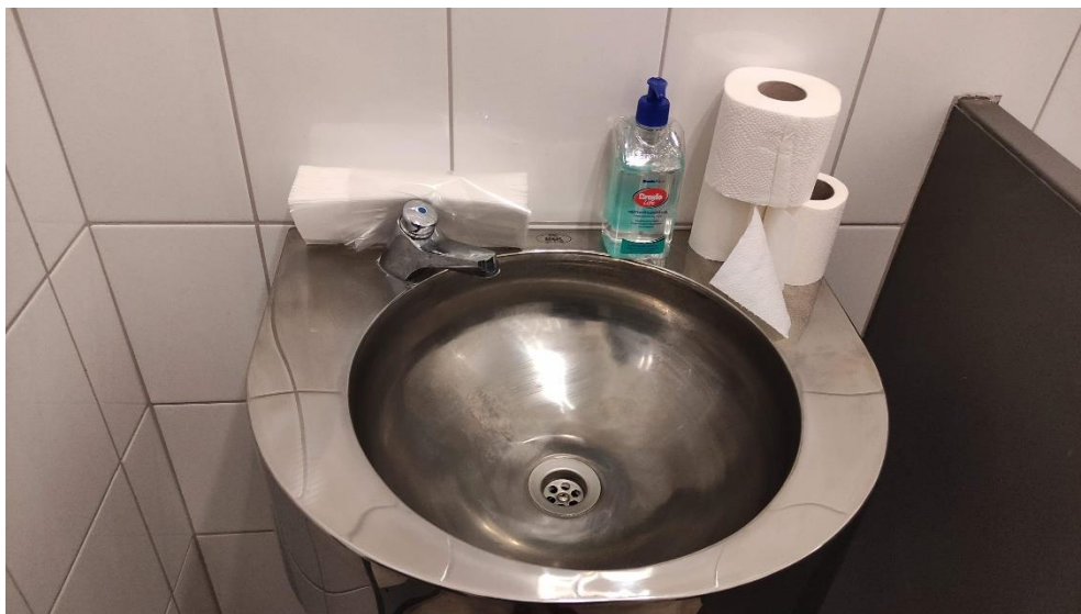
10. Az előállító egység mosdója