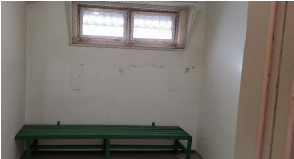
1. Az Ajkai Rendőrkapitányság előállító helyisége