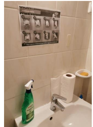
2. 3. 4. kép. Digitális oktatás eszközei; tartós élelmiszerek a raktárban; fertőtlenítőszer és a helyes kézmosás a mosdónál