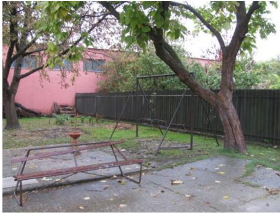
1. kép. A balesetveszélyes, használhatatlan pad