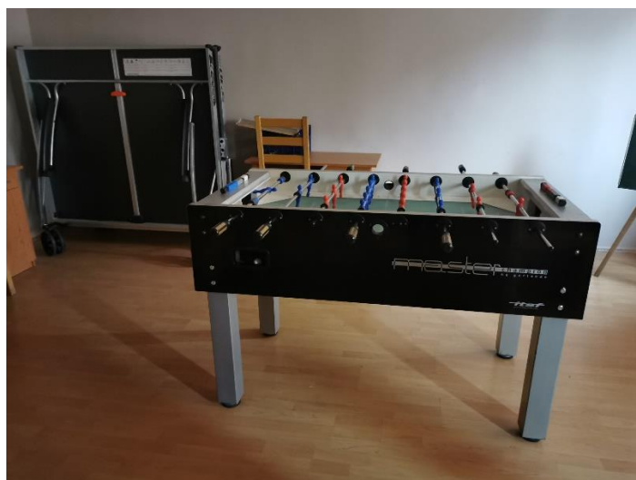
10. kép. Játékeszközök a sportszobában