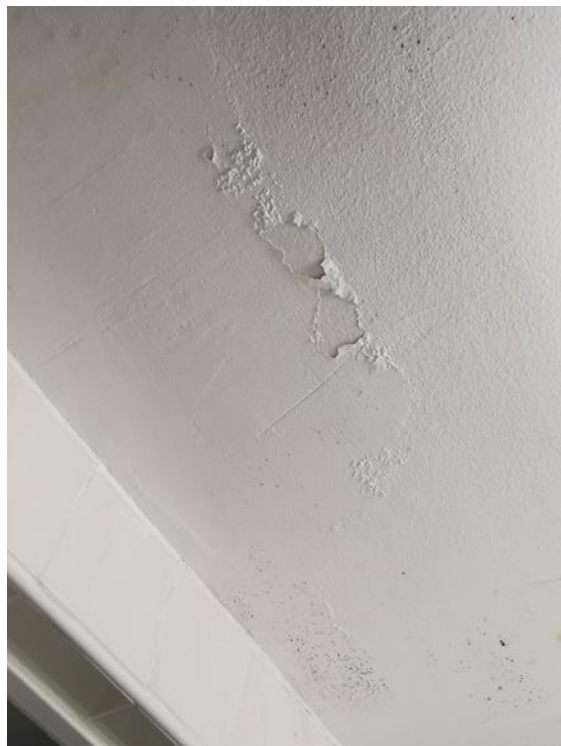
8. 9. kép. Festéshiány, lepergő vakolat az ajtófélfá mellett és vizesblokk plafonján