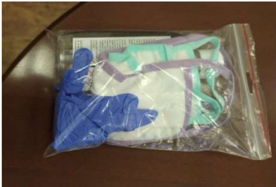
8. számú kép: Egyéni védőfelszerelés egységcsomag