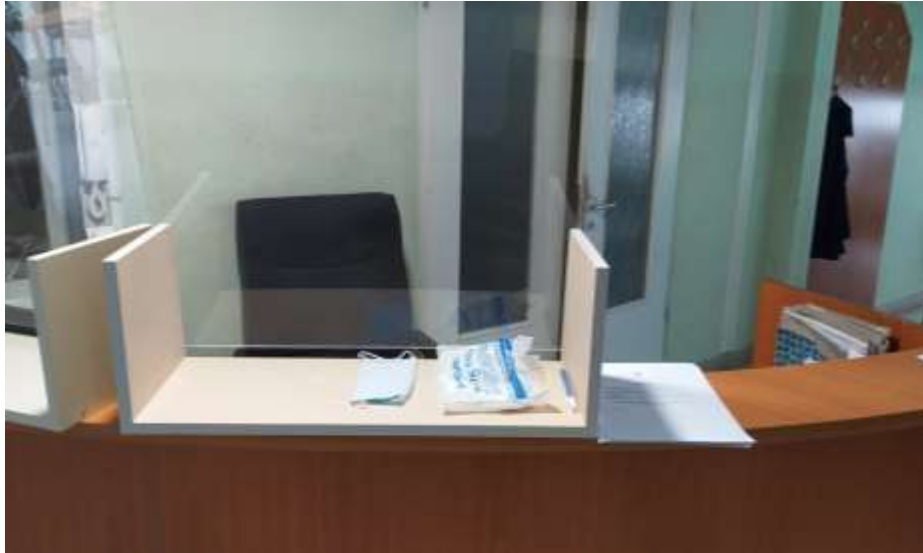
9. számú kép: Ügyfélirányító pult az Objektum bejáratánál