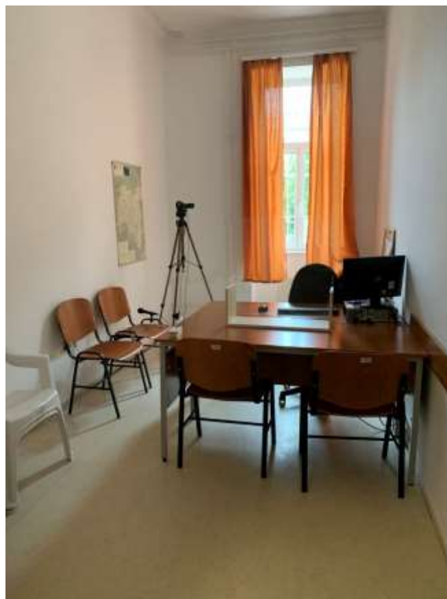
6. számú kép: Különleges meghallgató szoba