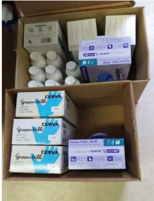
7. számú kép: Szolgálatban rendelkezésre álló védőfelszerelés