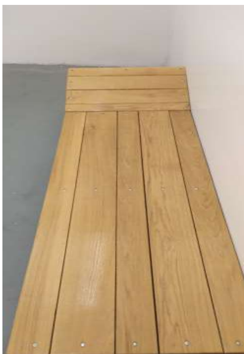
4. számú kép: Fekvőhely az előállító helyiségben