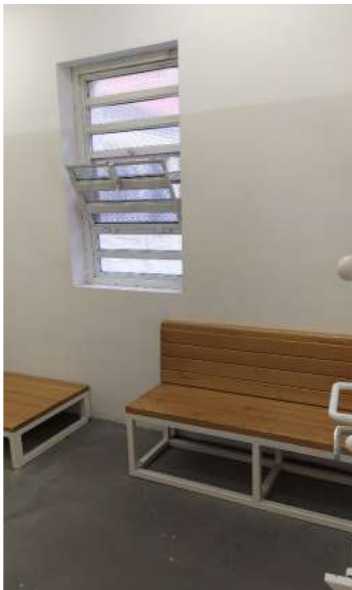
3. számú kép: Belülről nyíló biztonsági ablak az előállító helyiségben