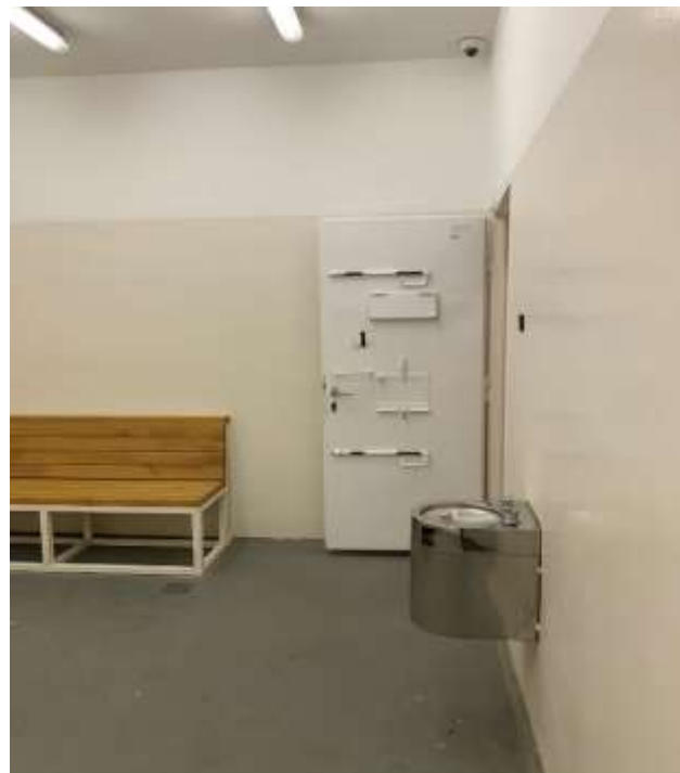
2. számú kép: Pad és ivókút az előállító helyiségben