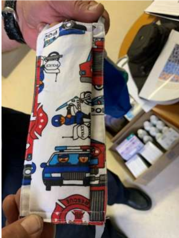
11. számú kép: Rendőrök számára rendszeresített szájmaszk