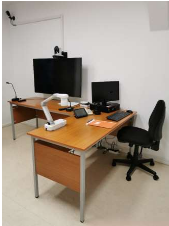
10. számú kép: Távkihallgató helyiség az Objektumban