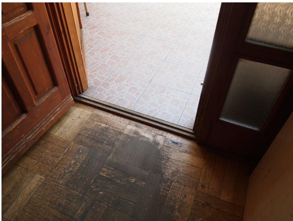
2. sz. kép: Az 51-es csoport épületének bejárata küszöbvel rendelkezik, mely az akadálymentes közlekedést megnehezíti.