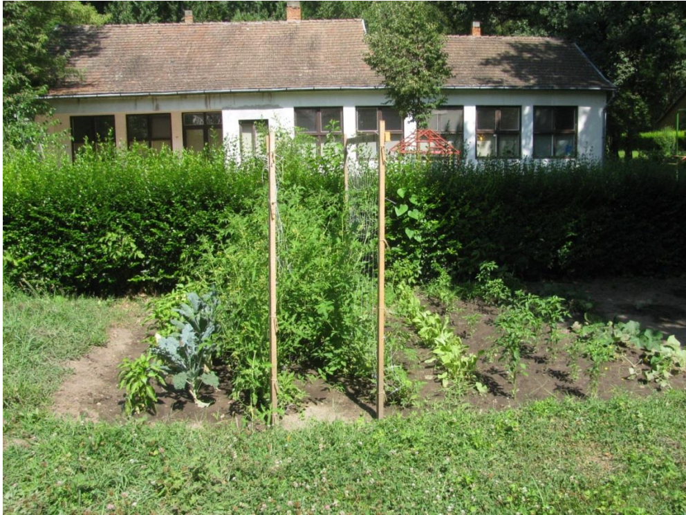
5. sz. kép: A csoportok szomszédságában kialakításra került egy kiskert, melyet az itt lakó gyermekek művelnek.