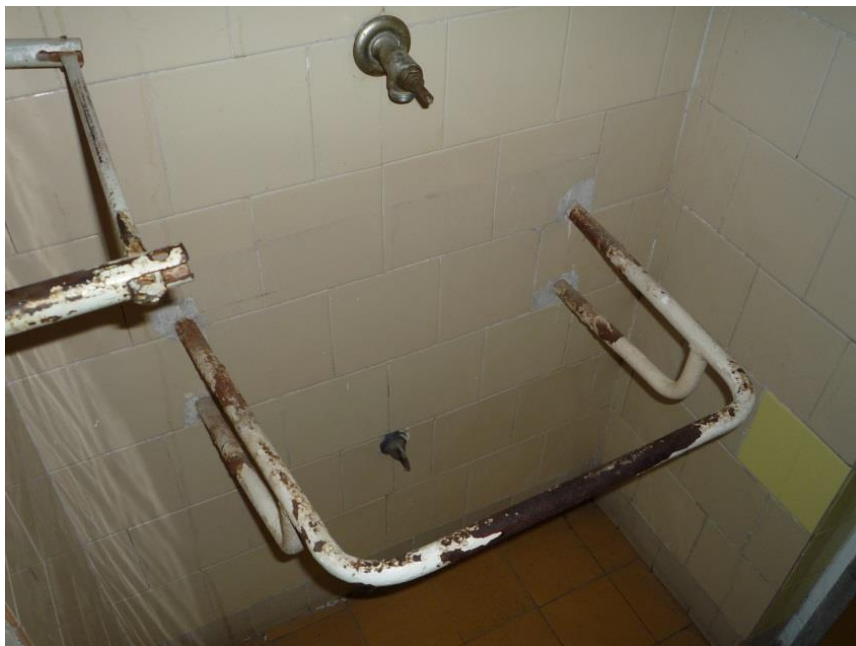
1. sz. kép: I-es ápolási egység – A WC blokkban hiányzik a mosdó, kézmosásra át kell menni a szomszéd helyiségbe.