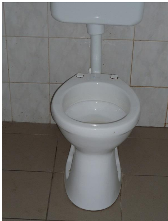
4-4. sz. kép: IV-es ápolási egység – Az egyik WC deszka törött volt, a másiktól hiányzott a deszka.