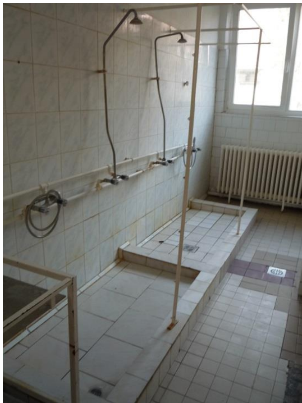
3. sz. kép: III-as ápolási egység – A zuhanyzók nem akadálymentesek és a látogatás időpontjában a zuhanyfülkék nem voltak függönnyel leválaszthatók